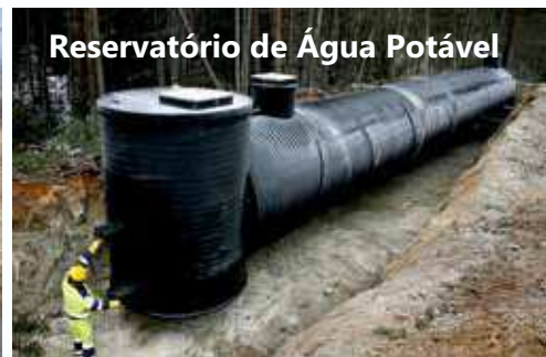
Reservatório de Água Potável