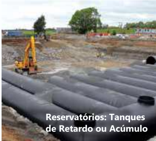
Reservatórios: Tanques de Retardo ou Acúmulo