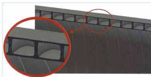
Detalhe do perfil KANAWEHOLITE

A KANAFLEX produz o tubo KANAWEHOLITE na Unidade de Embu das Artes /SP, a partir de um composto de polietileno de alta densidade, nos diâmetros que variam de DN/DI 800 até 3000 mm e podem ser fornecidos em classes de rigidez SN2 ou SN4. Os tubos são normalmente produzidos em comprimentos de 6 ou 12 metros, porém outros comprimentos podem ser fornecidos mediante consulta prévia. Os comprimentos dos tubos acabados têm uma tolerância de \pm 50 mm (23°C). O processo de fabricação é executado por extrusão. A parede do tubo KANAWEHOLITE consiste em perfis retangulares ocos, enrolados helicoidalmente, unidos através de soldagem, formando uma parede estruturada com superfícies externa e interna lisas, como se observa na figura abaixo: