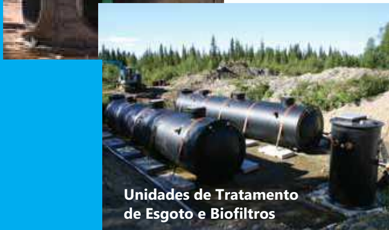
Unidades de Tratamento de Esgoto e Biofiltros