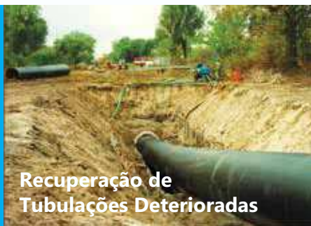
Recuperação de Tubulações Deterioradas