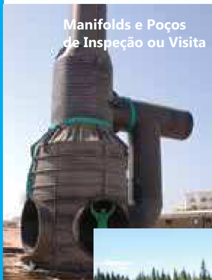
Manifolds e Poços de Inspeção ou Visita